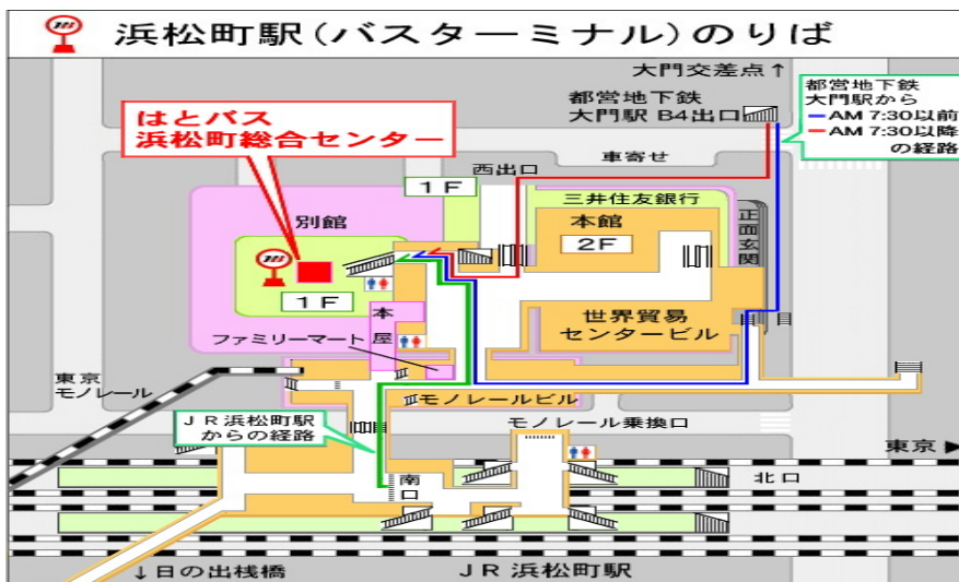
略図1. 浜松町駅前世界貿易センタービル内バスターミナル乗場