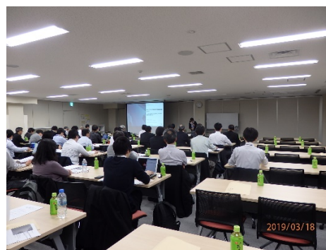
セミナーでの専門家の講演