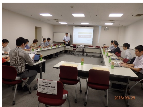
委員会での専門家との情報交換