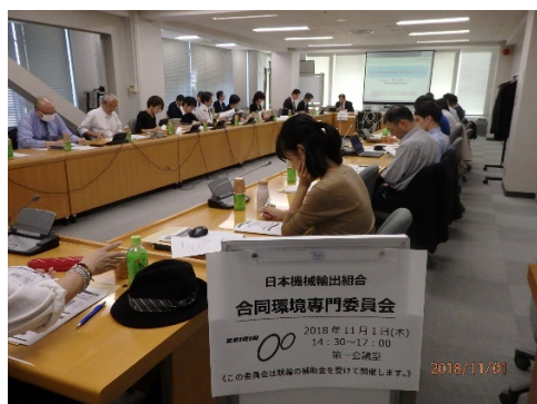
委員会での専門家との情報交換