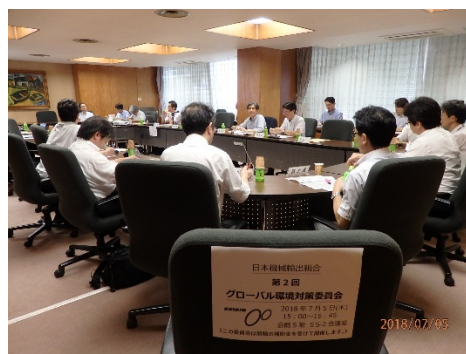
委員会での専門家との情報交換