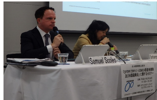
通商セミナーにおける専門家の講演（2）