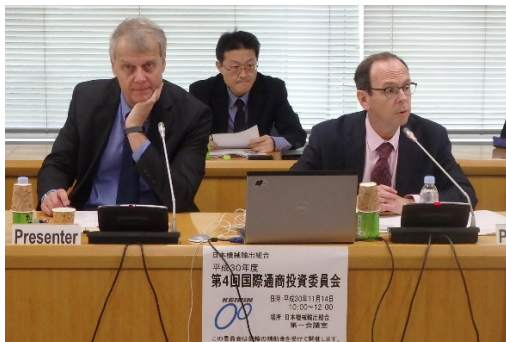
通商委員会における専門家の講演（2）