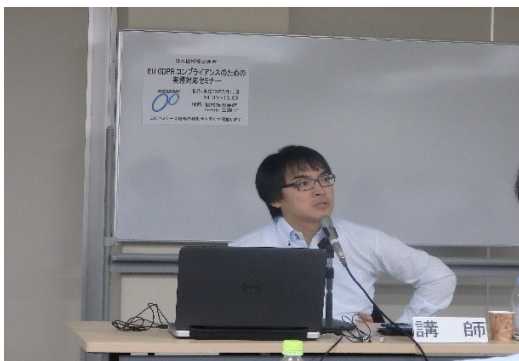
通商セミナーにおける専門家の講演（1）