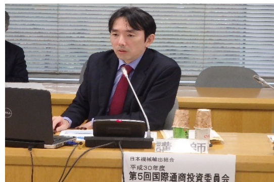
通商委員会における専門家の講演（1）